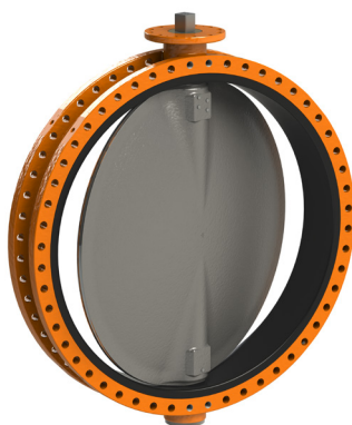
Valvole a farfalla con sede morbida vulcanizzata, configurazioni WAFER, LUG, DOPPIA FLANGIA